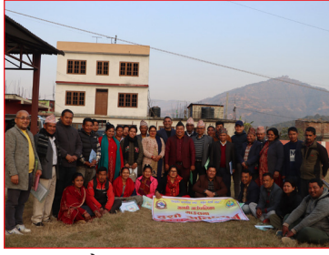
दशौँ गाउँसभा अधिवेशन