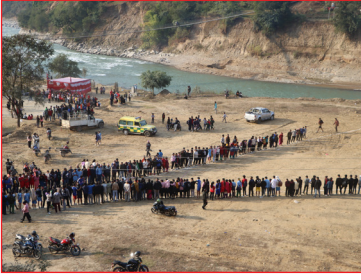
राष्ट्रपति रनिङ्गशिल्डको ज्याभ्लिन थ्रो प्रतियोगिता कार्यक्रम