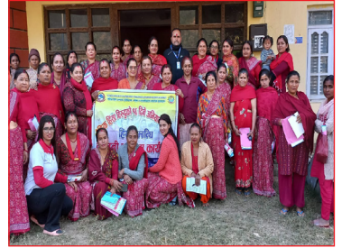
लैङ्गिक हिंसा विरुद्धको १६ दिने अभियान कार्यक्रम ।