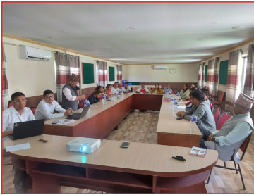
वैदेशिक रोजगारी तथा पार्श्वचित्र तयारी सम्बन्धी २ दिने आवासिय तालिम