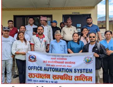
अफिस अटोमेशन सिस्टम सञ्चालन सम्बन्धि तालिम