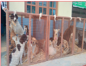
सामुदायिक तथा छाडा कुकुरहरुको स्थायी वन्ध्याकरण तथा विरुद्धको खोप कार्यक्रममा संकलन गरिएका कुकुरहरु