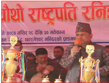
राष्ट्रपति रनिङ्गशिल्ड उद्घाटनमा अध्यक्षज्यूद्वारा शुभकामना व्यक्त गर्दै