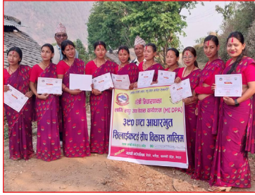
३२० घण्टा आधारभूत सिलाईकटाई सीप विकास तालिम ।