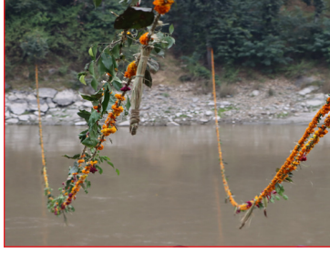
हरिवोधिनी एकादशी व्रतको दिन त्रिशुली नदी तारिएको फुलको डोरी