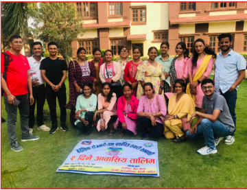
वैदेशिक रोजगारी तथा पार्श्वचित्र तयारी सम्बन्धी २ दिने आवासिय तालिम