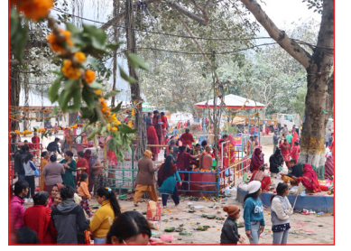
अम्लेश्वर मन्दिरमा हरिवोधिनी एकादशी व्रतको दिन