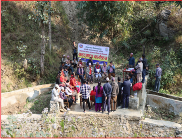
महेशफाँट सिंचाई योजनाको समुद्घाटन कार्यक्रम