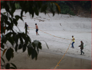
हरिवोधिनी एकादशी व्रतको दिन त्रिशुली नदीमा फुलको डोरी तारिँदै ।