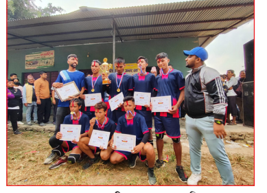
अन्तरवडास्तरीय पुरुष भलिबल प्रतियोगिता २०८० को विजेता वडा नं. १ को