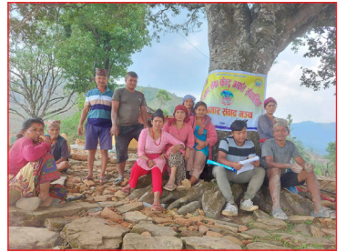
रोजगार संवाद मञ्च