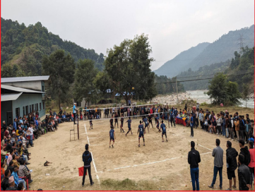
अन्तरवडास्तरीय पुरुष भलिबल प्रतियोगिता २०८०