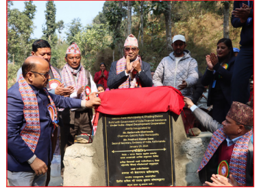
महेशफाँट सिंचाई योजनाको समुद्घाटन कार्यक्रम