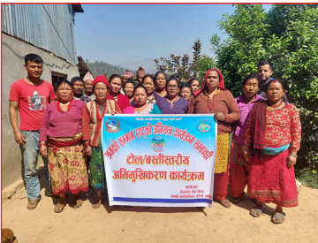
टोल/वस्तीस्तरीय अभिमुखिकरण कार्यक्रम