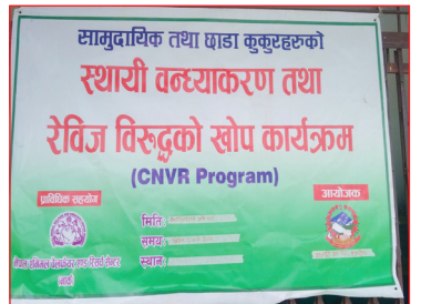
सामुदायिक तथा छाडा कुकुरहरुको स्थायी वन्ध्याकरण तथा रेविज विरुद्धको खोप कार्यक्रम