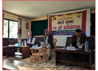
११औँ गाउँ सभा अधिवेशन ।