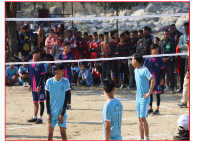
राष्ट्रपति रनिङ्गशिल्डको भलिबल