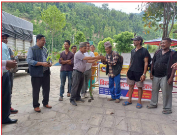
विरुवा वितरण कार्यक्रम