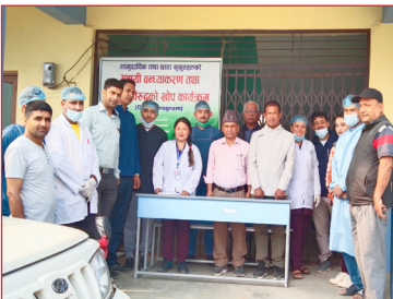
सामुदायिक तथा छाडा कुकुरहरुको स्थायी वन्ध्याकरण तथा विरुद्धको खोप कार्यक्रम