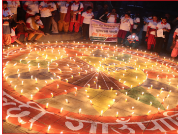
लैङ्गिक हिंसा विरुद्धको १६ दिने अभियान शुभारम्भ तथा दीप प्रज्वलन कार्यक्रम ।