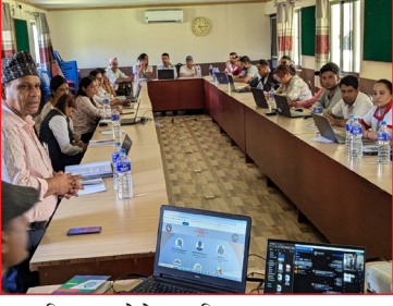
अफिस अटोमेशन सिस्टम सञ्चालन सम्बन्धि तालिममा अध्यक्षज्यूद्वारा शुभकामना व्यक्त गर्नुहुँदै ।