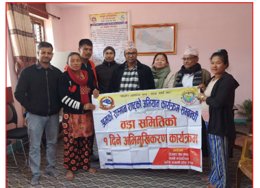
वडा समितिको १ दिने अभिमुखिकरण कार्यक्रम