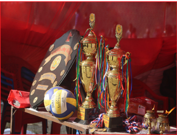
राष्ट्रपति रनिङ्गशिल्डको पुरस्कार ।