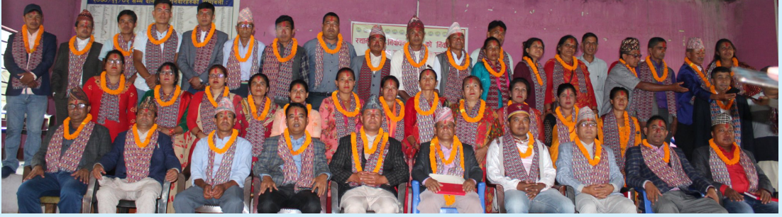
नव निर्वाचित जनप्रतिनिधिज्यूहरूको शपथ ग्रहण