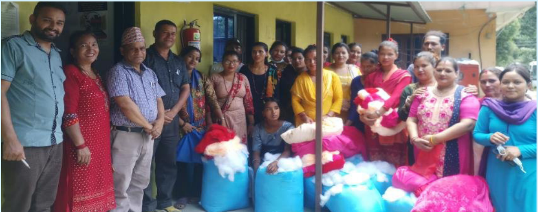
गुडिया बनाउने तालिम पश्चात प्रविधि हस्तान्तरण