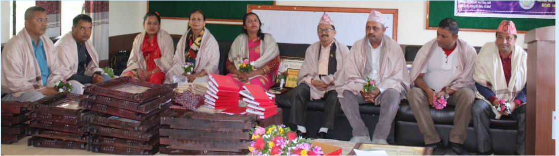
निवर्तमान जनप्रतिनिधिज्यूहरूको सम्मान कार्यक्रम