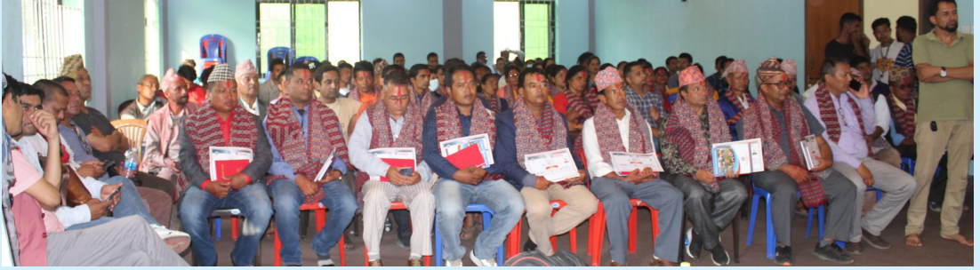
नव निर्वाचित जनप्रतिनिधिज्यूहरूलाई प्रमाणपत्र वितरण कार्यक्रम