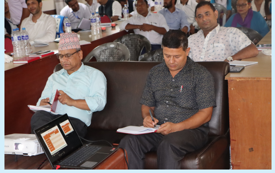
आ.ब. २०७८/०७९ वार्षिक समिक्षा