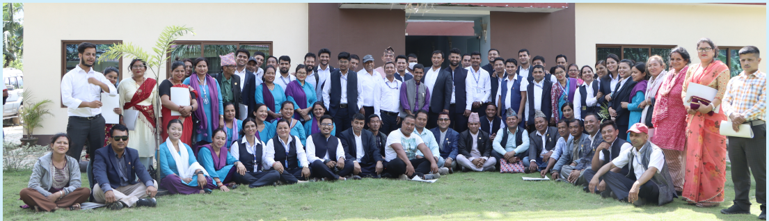
गाउँसभा पश्चात सामुहिक तस्बिर